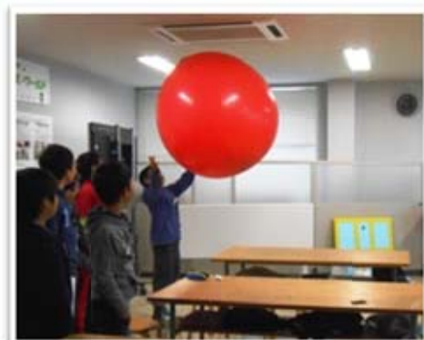
大きな風船を使って 重力と質量（空気の質量）の実験