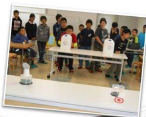
空気砲を使って、離れた まどを落とす実験