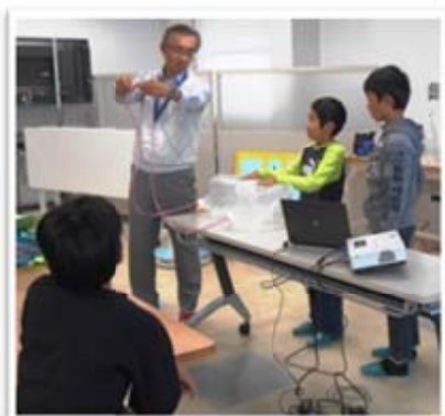
【気圧差による空気の移動】

大気（空気）の重さについて、説明を真剣に聞いています。重さは重力で引っ張られるから感じるということです。